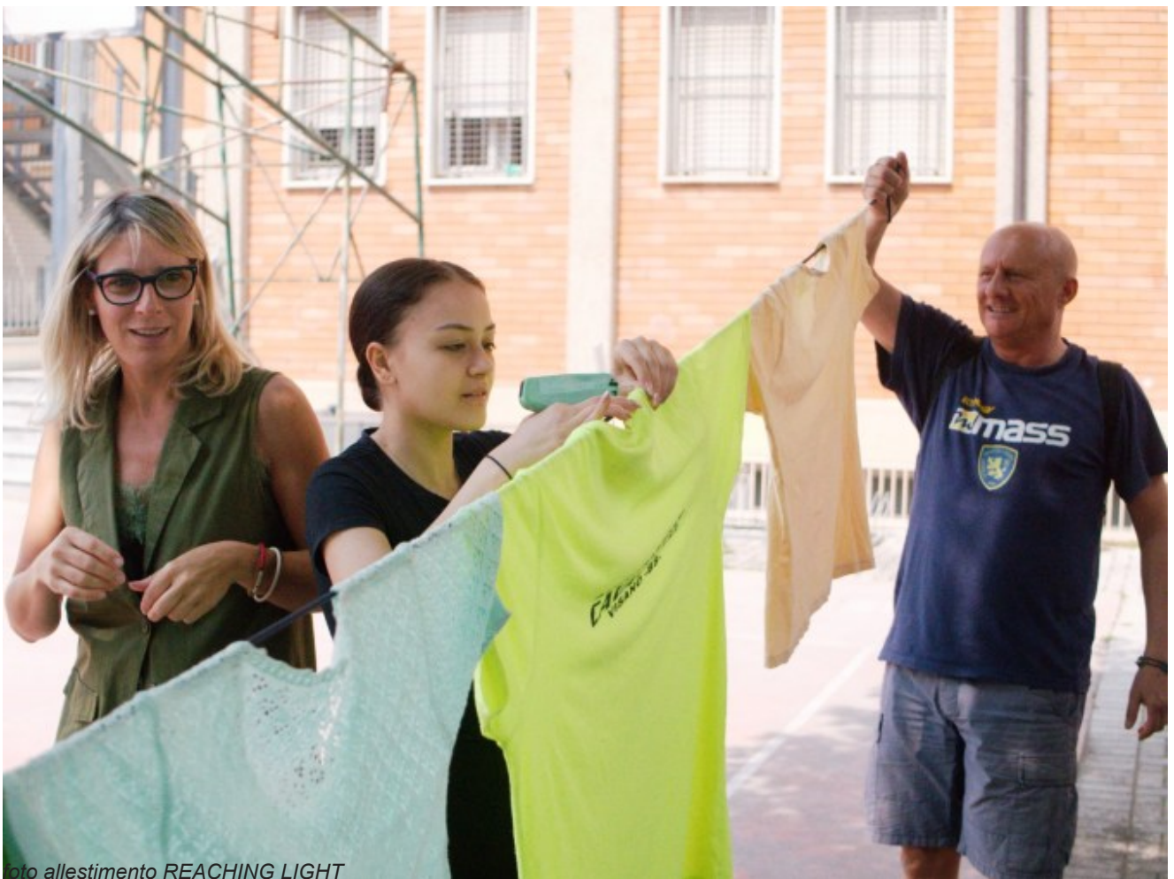
foto allestimento REACHING LIGHT