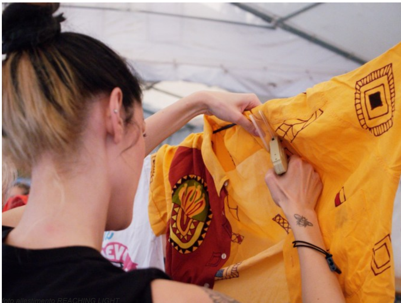
foto allestimento REACHING LIGHT

Si ringraziano L'Accademia Santagiulia, la Parrocchia Cristo Re e OH!FICOMAECO.